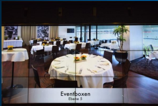
Eventboxen Ebene 5